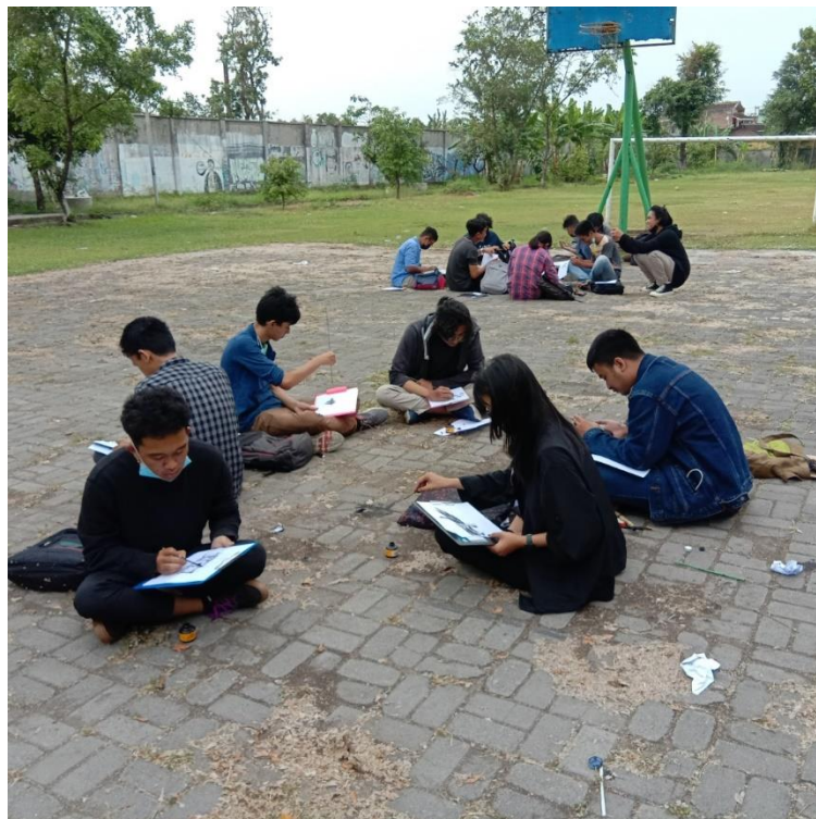
Gambar 5 mahasiswa sedang eksplere