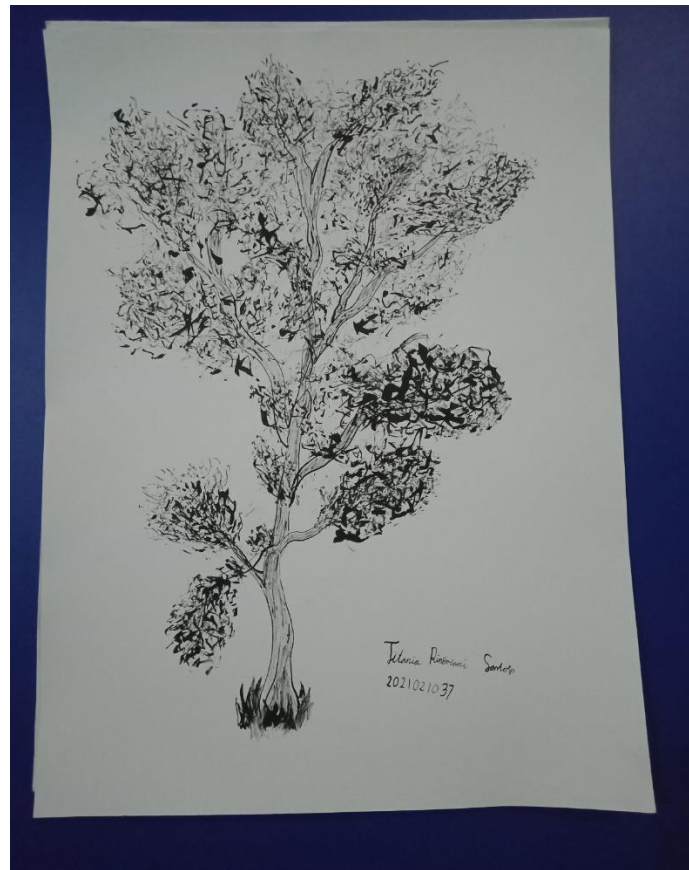
Gambar 6, Karya Titania "Pohon Beringin" , 2021