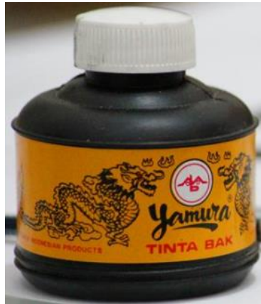
Gambar 2, Tinta cina, oleh arif , 2021

Proses ini dapat dilanjutkan sampai mendapatkan kepekatan tinta yang diperlukan. Waktu yang dibutuhkan tidak lama biasanya cukup beberapa menit saja. Tinta cina ini cepat mengering dengan mudah pada batu atau kuas.