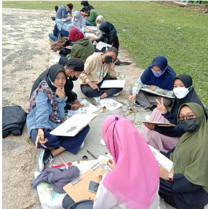
Gambar 4, mahasiswa sedang membuat sketsa di lapangan Usahid Surakarta, oleh Arif, 2021.