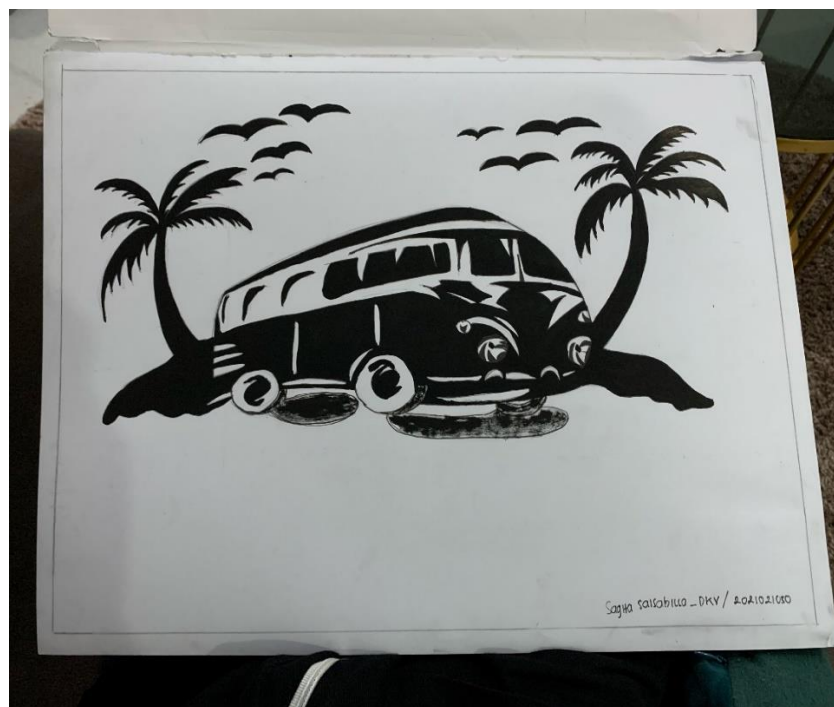
Gambar 7, Karya Sagita S, "VW Unique", 2021