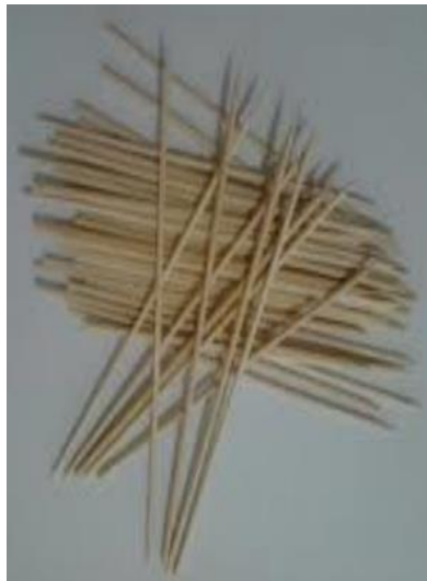
Gambar 1, lidi atau tusuk gigi, oleh arif, 2021

Lidi atau tusuk sate dapat juga digunakan untuk membuat karya sketsa menggunakan bahan tinta cina, efek yang ditimbulkan dari goresan lidi cukup artistik, karena dapat diatur tebal tipisnya goresan dengan menekan atau mengurangi tekanan saat menggoreskannya.