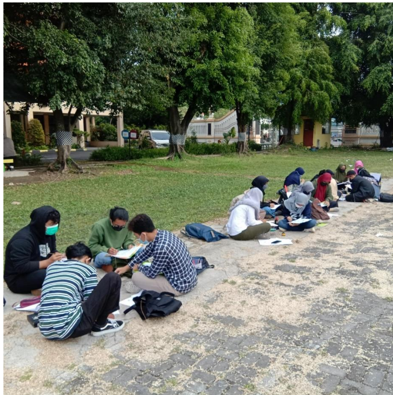
Gambar 3, mahasiswa sedang membuat sketsa dengan lidi dan tinta cina di Lapangan Usahid Surakarta, oleh Arif, 2021.

Berikut ini adalah foto kegiatan dan hasil karya mahasiswa saat melakukan kegiatan sketsa di lapangan Universitas Sahid Surakarta.