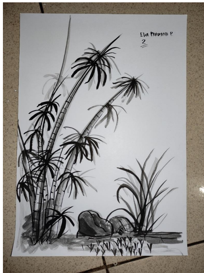
Gambar 9, Karya Eka " Bambo" , 2021