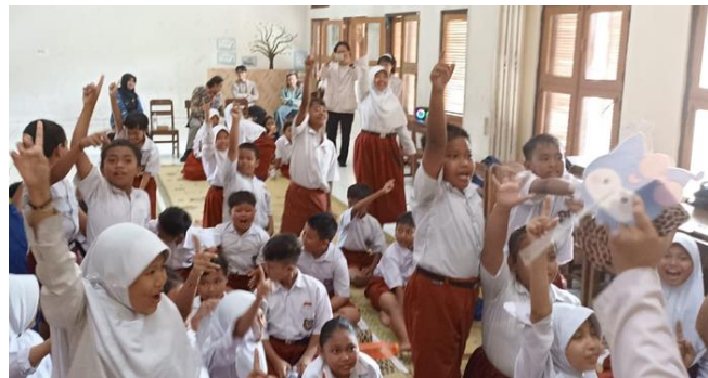
Gambar 2. Siswa mengikuti Diskusi Dengan Antusias

Setelah menonton, siswa diarahkan untuk mendiskusikan kembali pola-pola kain lurik dengan bimbingan tim pelaksana. Kegiatan ini berfungsi untuk memperdalam pengetahuan mereka mengenai struktur pola, nilai estetika, serta arti simbolik di balik desain garis-garis pada lurik. Hasil diskusi menunjukkan berbagai interpretasi kreatif dari siswa, mulai dari motif yang sederhana hingga yang lebih eksploratif dengan mengenali warna dan pola khas motif lurik. Tidak hanya siswa yang menunjukkan antusiasme, guru-guru pun menyatakan bahwa metode ini sangat membantu dalam mengenalkan budaya lokal secara kontekstual. Mereka merasa motion comic bisa menjadi sumber ajar tambahan dalam pelajaran tematik atau muatan lokal. Hal ini membuka peluang untuk integrasi lebih lanjut ke dalam kurikulum sekolah.