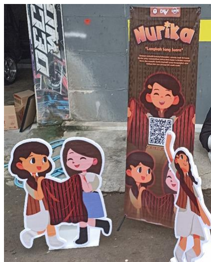
Gambar 4. Media Tambahan Yang Digunakan Selama Proses Pembelajaran

Dengan demikian, kegiatan pengabdian ini tidak hanya menciptakan sebuah produk media pendidikan yang menarik dan informatif, tetapi juga memberikan kontribusi nyata dalam meningkatkan kesadaran budaya sejak usia dini. Metode ini terbukti berhasil sebagai strategi untuk melestarikan budaya lokal melalui pendidikan dasar dengan memanfaatkan teknologi digital yang familiar bagi anak-anak