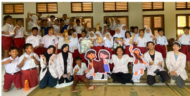
Gambar 5. Kebersamaan antara Tim Pelaksana Pengabdian dan Siswa

Hasil dari pengabdian masyarakat di SDN Mijipinilihan Surakarta menunjukkan bahwa media pembelajaran yang berbasis motion comic efektif sebagai strategi edukasi untuk memperkenalkan warisan budaya tenun lurik kepada siswa sekolah dasar. Keberhasilan ini terlihat tidak hanya dari tingginya minat siswa terhadap cerita (rata-rata 4.56), namun juga dari bertambahnya pemahaman mereka terhadap nilai-nilai budaya lokal yang sebelumnya akrab atau hanya dikenal secara singkat.